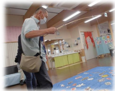
生活介護事業所すまいるでの体験の様子

前年度に引き続きまつくらセンターでは『利用者様のライフステージに応じた福祉サービス等の検討』を重点項目として掲げ、日頃の作業の合間に黒川郡内のB型事業所や生活介護事業所の見学と体験利用を行っています。