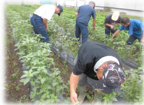
就労継続支援B型大郷ファームでの体験の様子